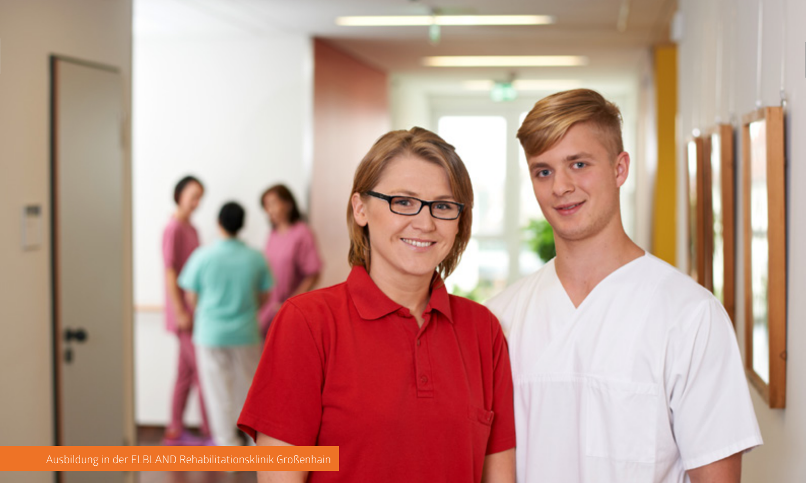
Ausbildung in der ELBLAND Rehabilitationsklinik Großenhain